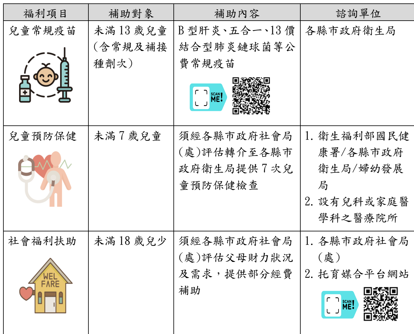
隨父母隱匿之失聯移工子女相關醫療及福利措施一覽表